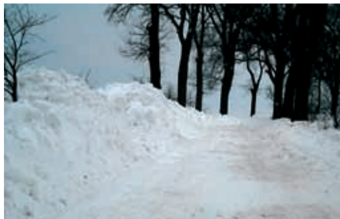
Tegoroczna zima była wyjątkowo długa i uciążliwa. Przez prawie cztery miesiące na ulicach zalegał śnieg..