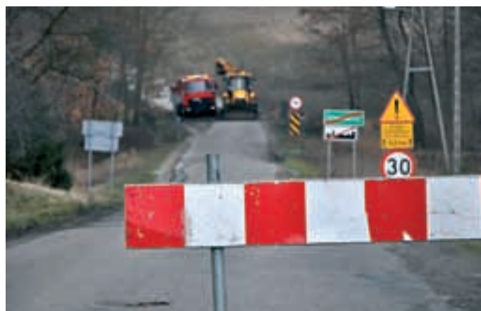
Już 23 marca służby drogowe rozpoczęły naprawę zniszczeń i remonty naszych dróg powiatowych.