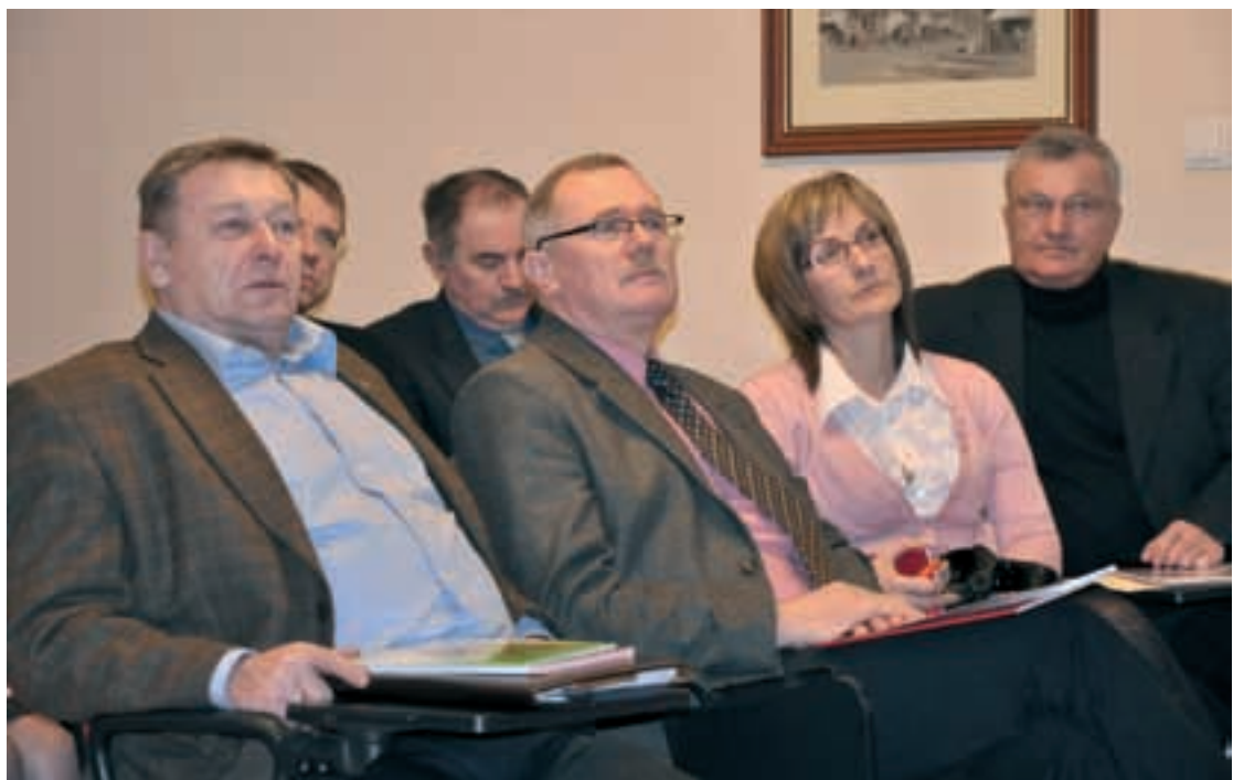
DG Uczestnicy Konwentu Starostów i Wicestarostów Lubuskich