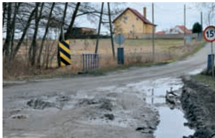
Kiedy przyszła odwilż, okazało się, jak bardzo zniszczone są nawierzchnie dróg..